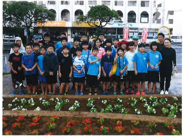
ボランティア終了後、きれいに植えた「希望の花園」花壇の前で皆さんそろって記念写真！