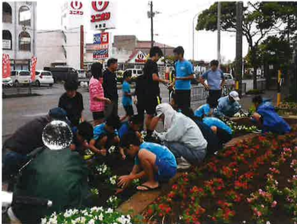
浦添小学校ハンドボール部児童、保護者と一緒 に花植ボランティアを楽しみました！

今回、会員のお孫さんがハンドボール部に所属しているとのことで、当部の父母会長に相談したところ、「子どもたちにも良い経験をさせたい」と快く承諾。部活が始まる前の朝早くから集まり、センター会員と一緒にボランティア活動をしながら世代交流を楽しみました。